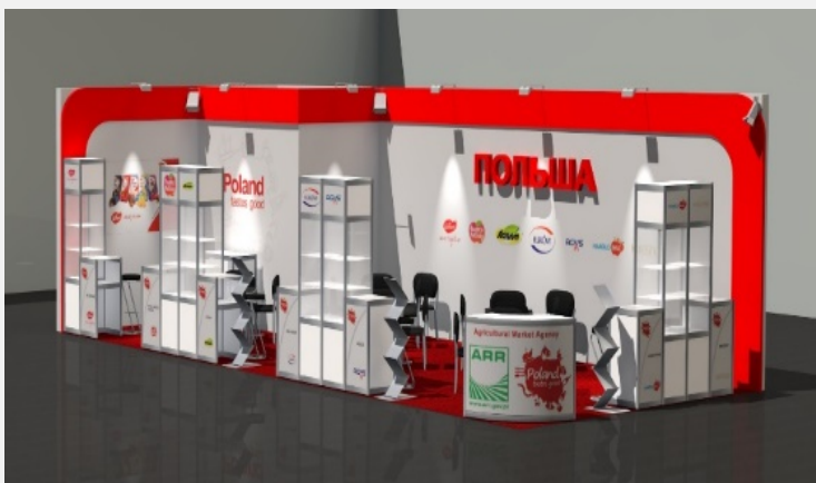
World Food Kazakhstan 2015 Almaty, Kazachstan Typ stoiska: narożne Powierzchnia: 55 m2 Agencja Rynku Rolnego