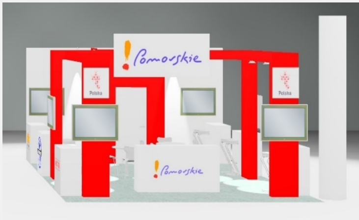
Power Expo Almaty 2019 Almaty, Kazachstan Typ stoiska: półwyspowa Powierzchnia: 48 m2 PPNT Gdynia – Pomorskie