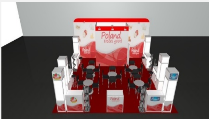
Saudi Agriculture 2017 Typ stoiska: narożne Powierzchnia: 64 m2 Krajowy Ośrodek Wsparcia Rolnictwa